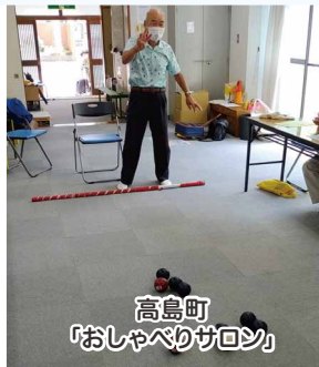
高島町「おしゃべりサロン」