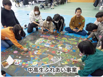
中高生ふれあい事業