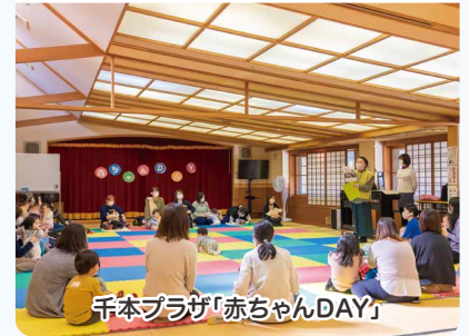
千本プラザ「赤ちゃんDAY」